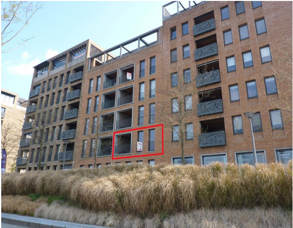
Figuur 2: voorbeeld 'inpendig terras' (rode kader)

Terrassen die zichtbaar zijn vanuit bovenaanzicht worden meegerekend als verharde oppervlaktes. Terrassen die niet zichtbaar zijn vanuit bovenaanzicht ('inpendige terrassen') moeten niet meegenomen worden in de berekening (zie Figuur 2 ).