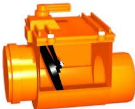
Figuur 1: voorbeeld terugslagklep

Hier wordt er aangekruist of er een terugslagklep aanwezig is op de DWA.